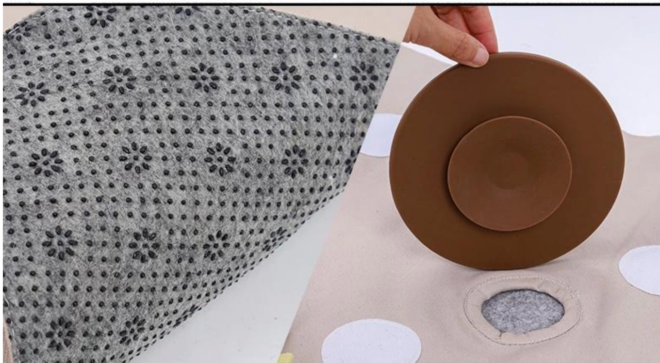
Durable oxford fabric easy to clean