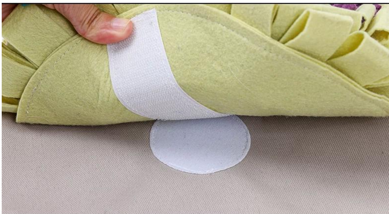
Soft closure for fitting snuffle parts