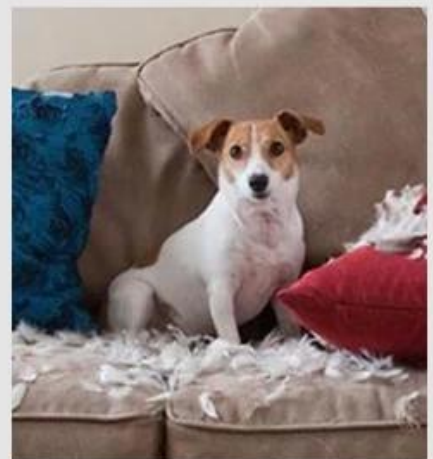
03 Destroy furniture