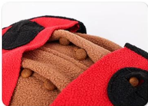
1.Hide the food