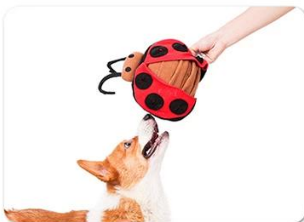
4.And interact with dog