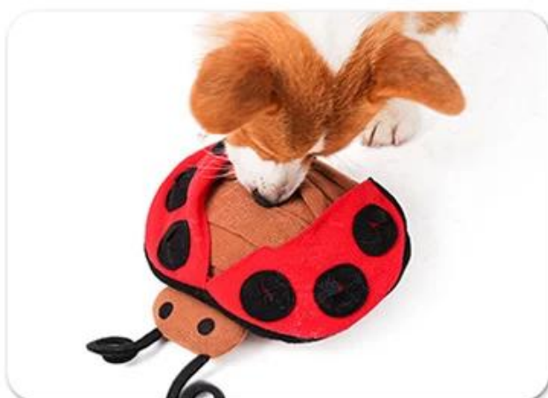
3.Let the dog play