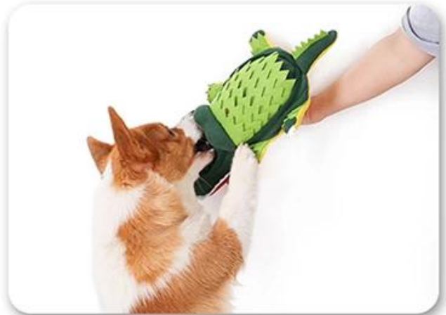
3.And interact with dog