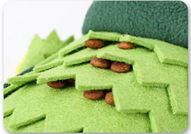
1.Hide the food