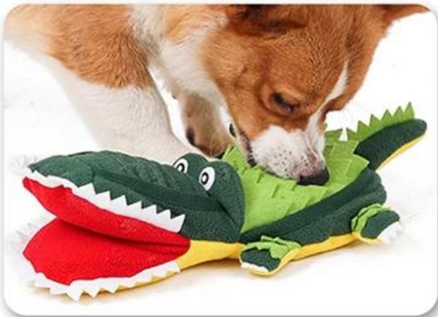
2.Let the dog play