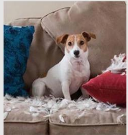
03 Destroy furniture