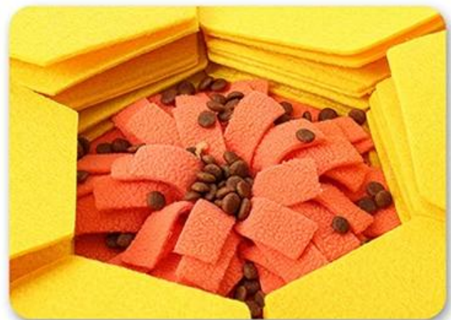
4.Can use as snuffle bowl