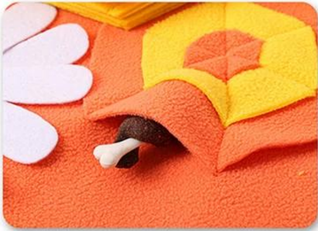
1.Hide the food