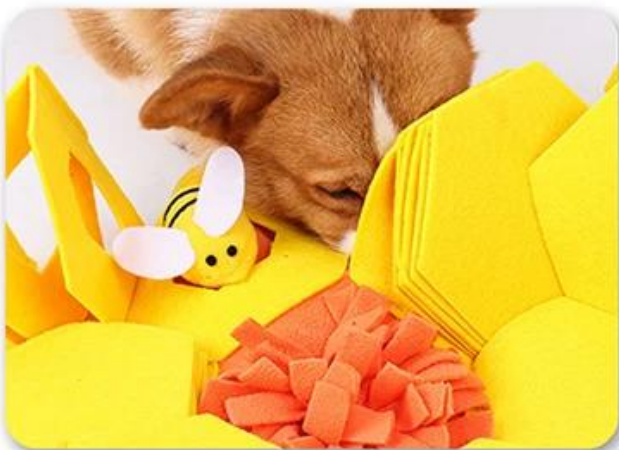
3.Let the dog play