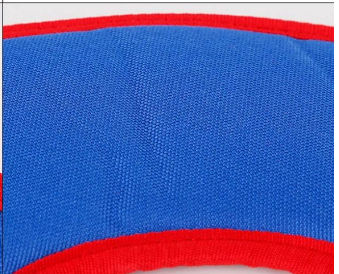
Water resistant oxford fabric Soft foam