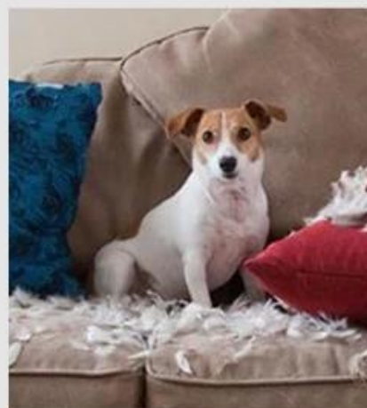
03 Destroy furniture