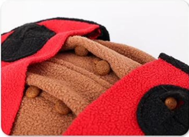
1.Hide the food