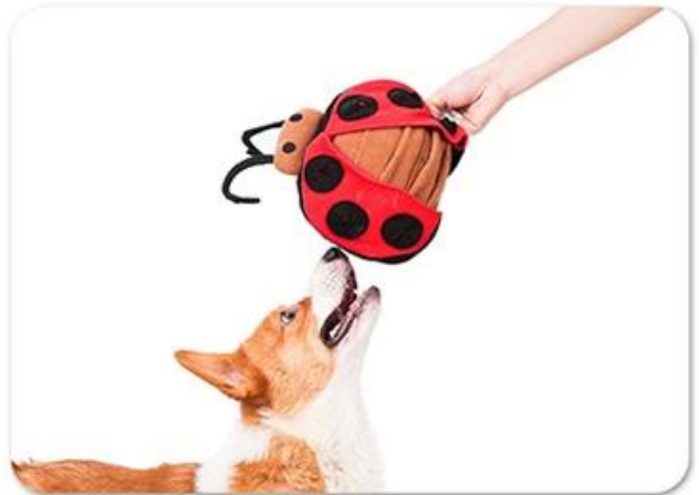
4.And interact with dog