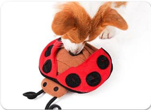
3.Let the dog play