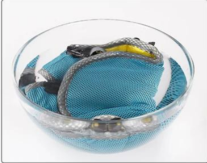
Cooling Touch Fabric