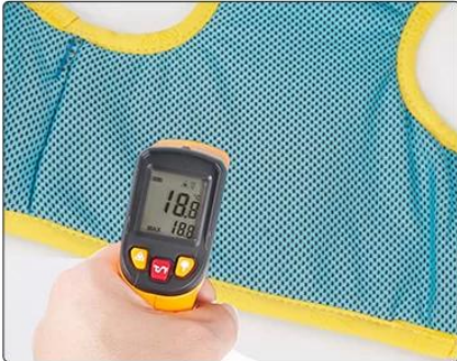
Annnd, it cools!