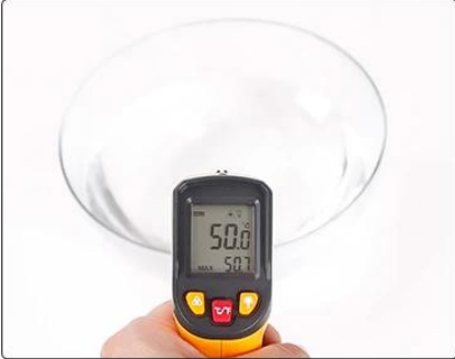
50°C/122°F warm water