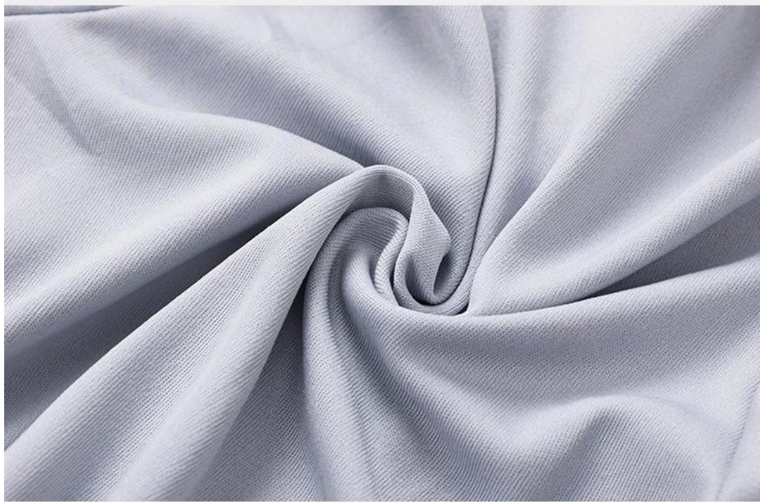
Cationic polyester fabric