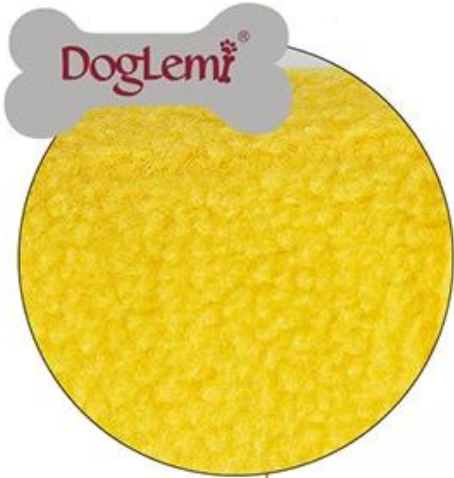
Soft fleece outer