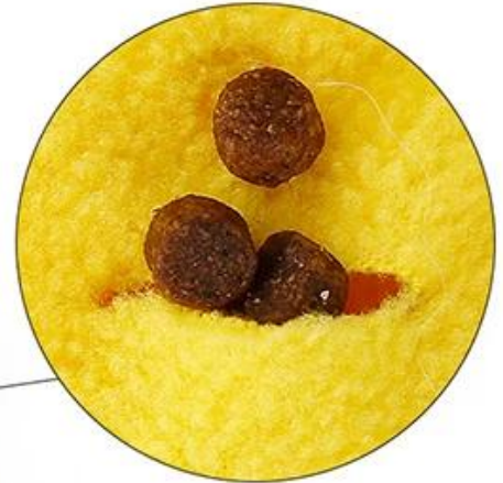
With holes on wings