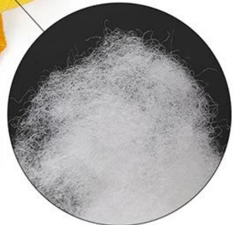
Soft polyester stuffing, with squeaker inside