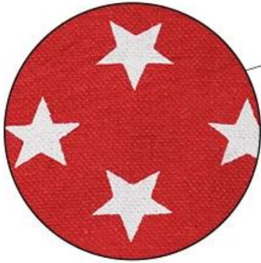
Star Design Canvas