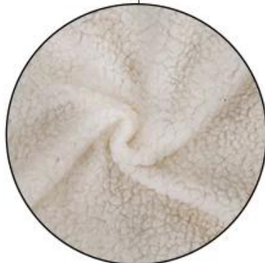
Warm Soft Sheepskin