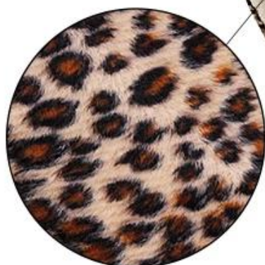
Warm Leopard Plush