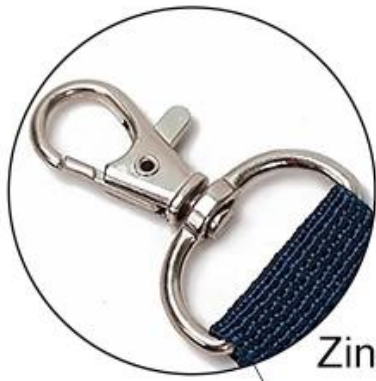
Zinc Plated Hook