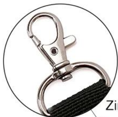
Zinc Plated Hook