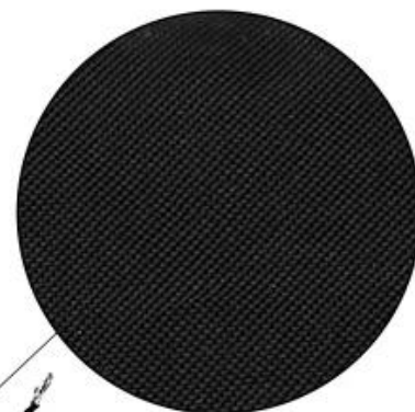
Oxford fabric, hair free