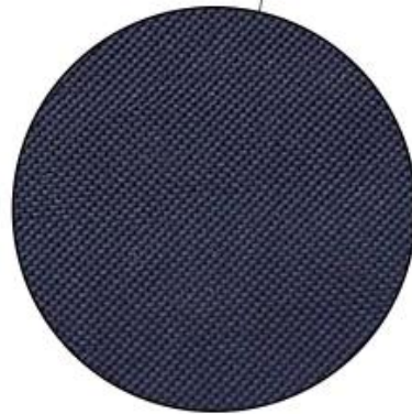
Oxford fabric, hair free