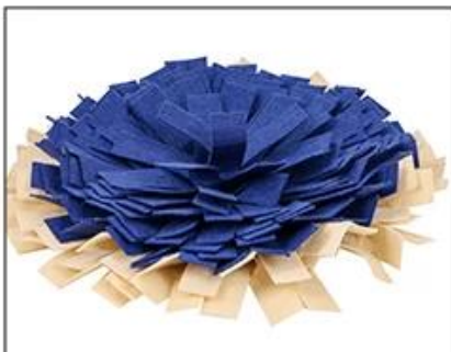
1.Low Level option