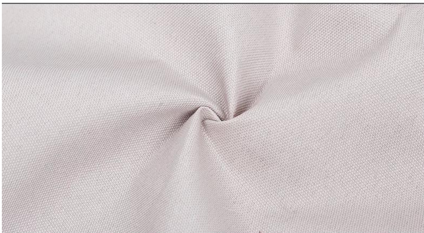
清爽牛津布，防泼水，易清洁