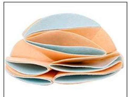
3.High level option