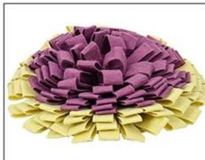
2.Medume level option