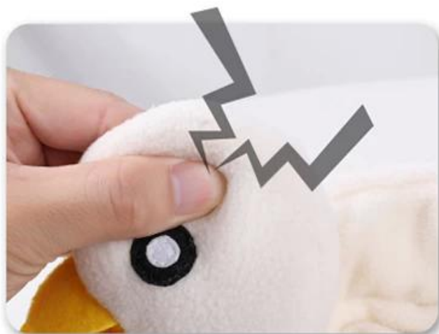
2.按响BB叫，吸引狗狗注意力