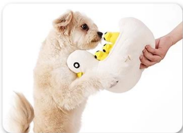
4.还能和狗狗互动，增加感情