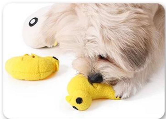
3.让狗狗去嗅闻，玩耍