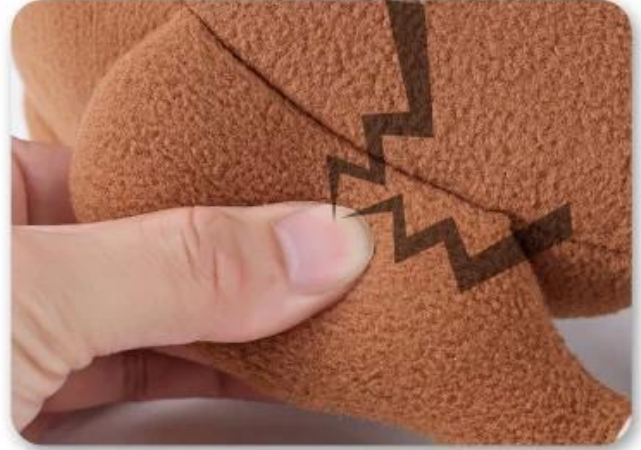
2.按响bb叫，吸引狗狗注意力