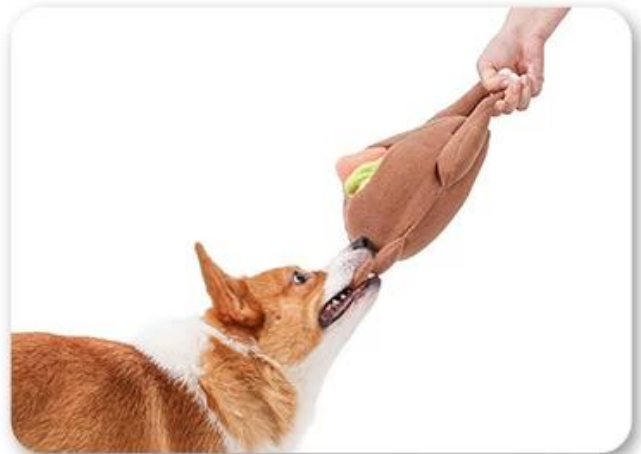
4.还能和狗狗互动，增加感情