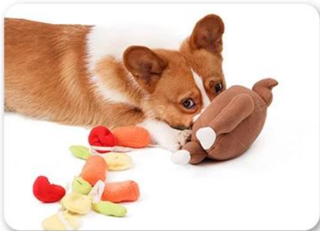
3.让狗狗去嗅闻，玩耍