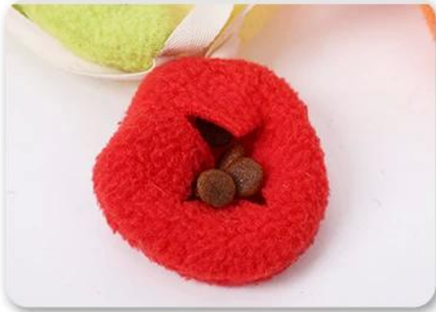
1.将食物/零食藏进藏食区