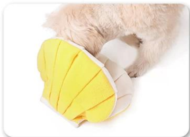
3.让狗狗去嗅闻，玩耍