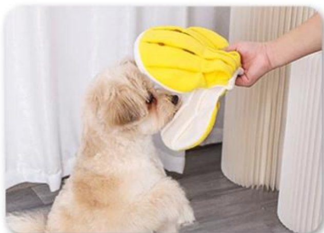
4.还能和狗狗互动，增加感情