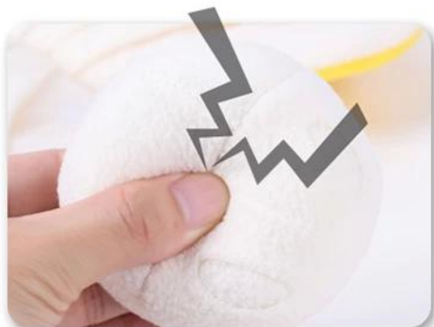
2.按响BB叫，吸引狗狗注意力