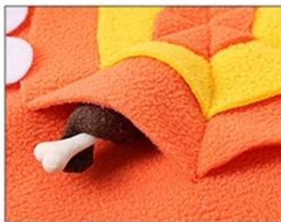
2. 多处藏食， 锻炼狗狗的嗅闻能力