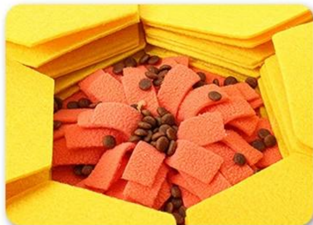
4.还可以作慢食狗碗使用