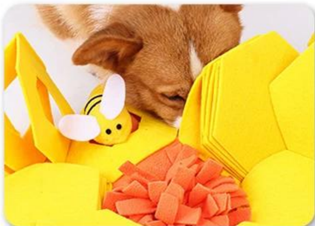
3.让狗狗去嗅闻，玩耍