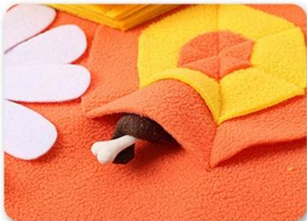
1.将食物/零食藏进藏食区