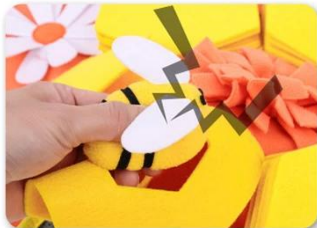
2.按响bb叫，吸引狗狗注意力